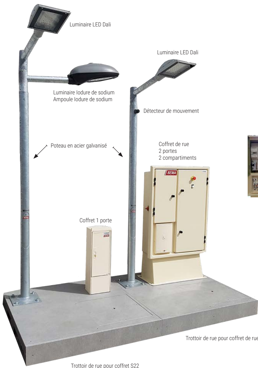
SOUS ENSEMBLE COFFRET DE RUE