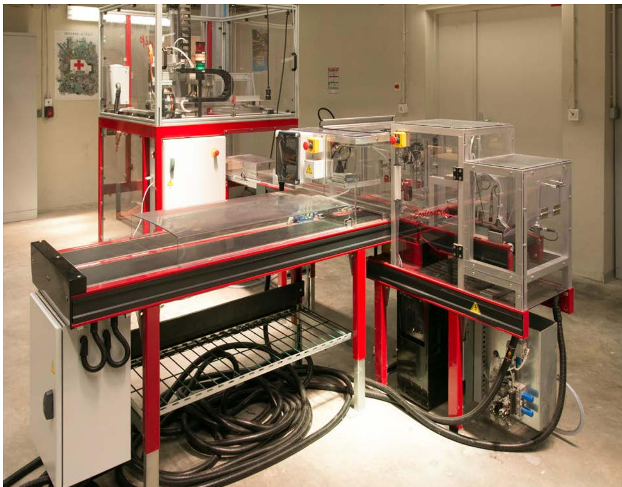
EcolControl + EcolStock + EcolManip