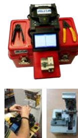
Soudeuse optique Cœur à Cœur