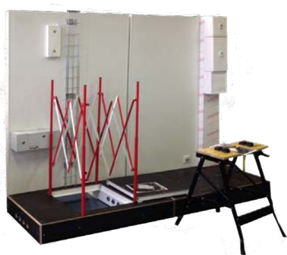
Pack Voirie Fibre Optique FTTH installer sur Panneau de rue avec option GTL