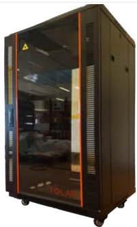
Point de Mutualisation