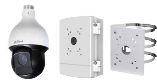
1 Caméra Dôme + 1 boîtier et embase + 1 support poteau