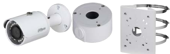
2 Mini caméras tube, 2 embases étanches + 2 supports poteaux