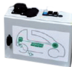
Coffret pour la simulation de présence de véhicule