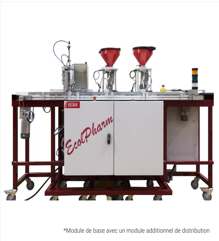
*Module de base avec un module additionnel de distribution