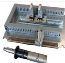
Distributeur de granules