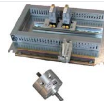
Distributeur de bouchons