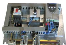
Distributeur de tubes